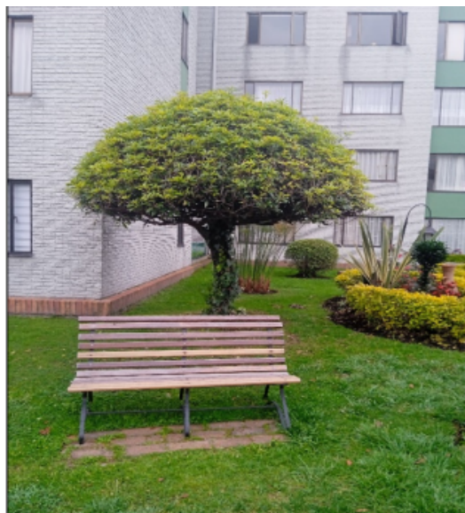
Vista general de individuo de Jazmín del cabo intervenido.