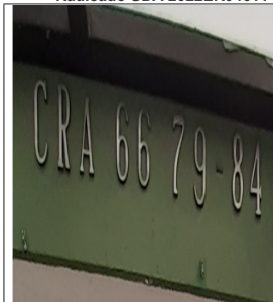
Dirección de la visita.