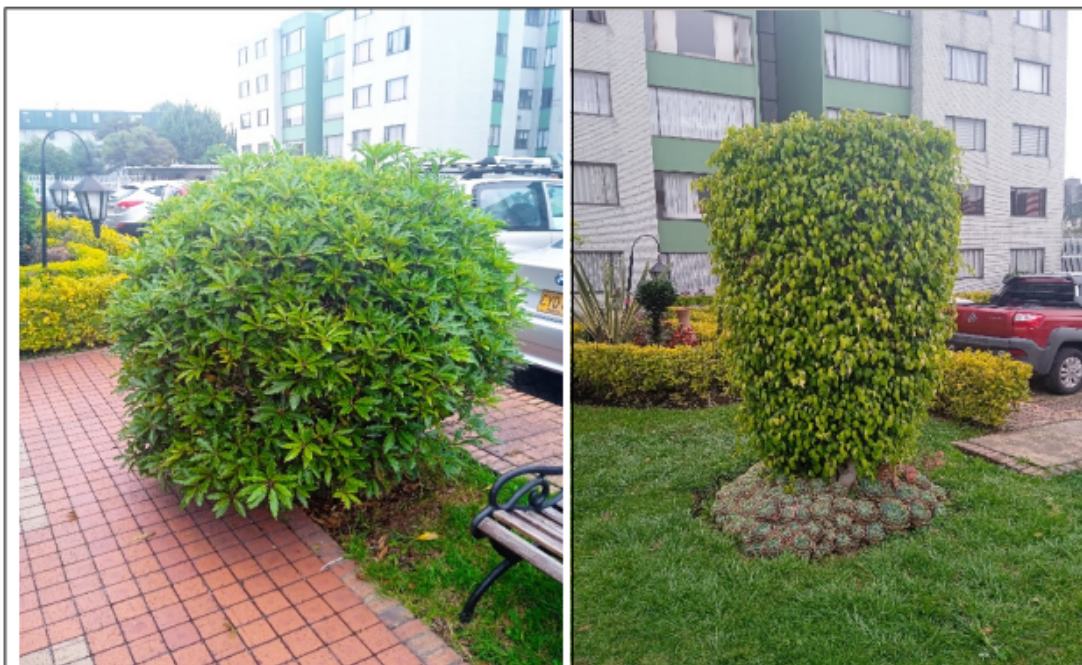
Vista general de individuo de Jazmín del cabo intervenido.