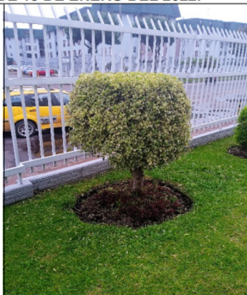
Vista general de individuo de Caucho benjamín intervenido.