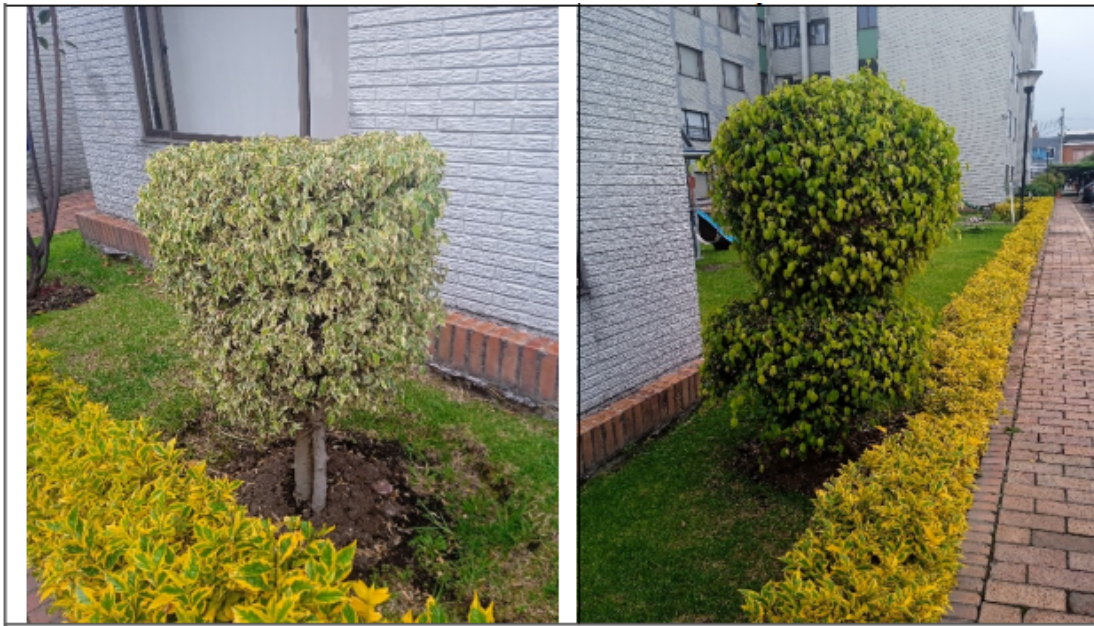
Vista general de individuos de Caucho benjamín intervenidos.