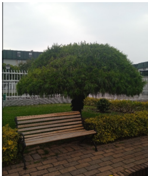
Vista general de individuo de Pino candelabro intervenido.